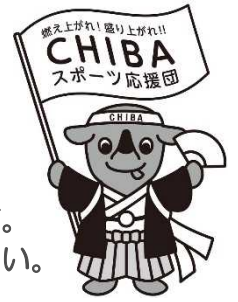
千葉県マスコット キャラクター「チーバくん」

県では商店街の活性化に向けて様々な支援メニューを用意しています。 がんばる商店街を全力で応援してまいりますので、是非御活用ください。