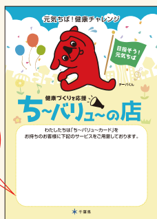
ステッカー (A5サイズ)